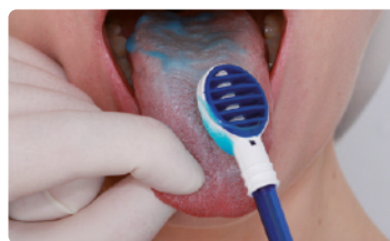
3. Wmasuj żel w język stroną z wypustkami czyszczaka TS1