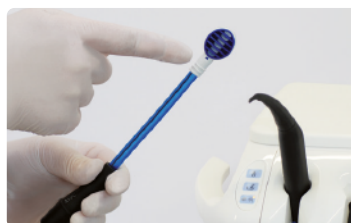
1. Połącz czyszczak z rączką

Czyszczak do języka TS1 to produkt wysokiej jakości, wyprodukowany w Niemczech zgodnie z normą ISO 9001.