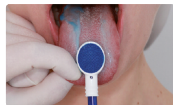
4. Wyczyść język za pomocą prążkowanej strony czyszczaka. GOTOWE!