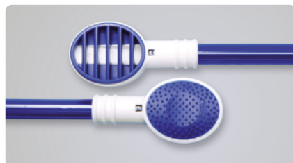
Fot. 1 Czyszczak do języka TS1 - strona z wypustkami do wmasowywania żelu oczyszczającego, strona karbowana do czyszczenia.