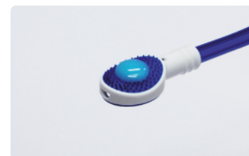
2. Nałóż żel na stronę z wypustkami.